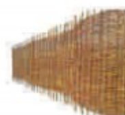
Hazelnoot & Wilg Tuinschermen